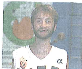
Dho (T.T.B. Pino)

RISULTATI, 6ª di ritorno: Vercelli-Pinerolo 76-75; Ivrea-T.T.B. Pino 74-56; Kolbe-Reba 56-73;